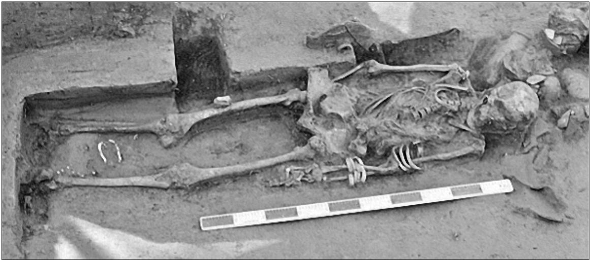
Figure 15. Exemple d'inhumation typique du cimetière R37 : le corps est allongé sur le dos, tête au nord – réf. H87/127a. (N. C. Lovell ) 46

Nous ne quitterons pas cette zone des cimetières sans jeter un œil sur le dénommé « H » lequel, comme dit précédemment, date d'une période post-harappéenne, à savoir 1900 à 1300 AEC. On y voit une transition vers d'autres pratiques funéraires puisque, dans la couche la plus ancienne (strate II), les corps conservent la position allongée du cimetière R37, mais les genoux sont ici légèrement fléchis et l'orientation est différente : est / ouest ou sud-est / nord-ouest. Par contre, dans la strate I, plus récente, on passe à des inhumations en jarre. Cela étant, en dépit des changements dans le mode d'inhumation, nous restons dans la continuité de la période harappéenne, avec des décors de poterie typiques, telle la feuille de l'arbre pipal ( Ficus religiosa ), arbre de tout temps sacré en Inde, depuis les temps pré-védiques jusqu'à nos jours. (Faut-il le rappeler, c'est sous un arbre pipal que, selon la tradition, le prince indien Siddhārtha Gautama devint Buddha.)