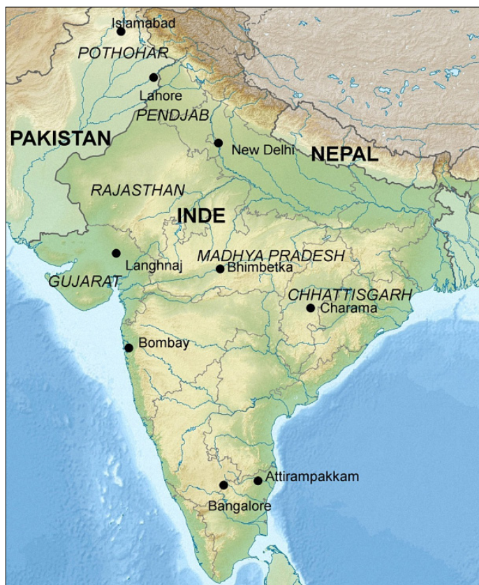
Figure 3. (Jacques Gossart, d'après Uwe Dederig at German Wikipedia)

découverte majeure car, non seulement elle enrichit considérablement les connaissances en matière de préhistoire du sous-continent indien, mais elle constitue également un élément important dans l'étude des migrations humaines en Asie depuis l'Afrique. (Il faut noter toutefois que cette théorie du « grand ancêtre africain » est aujourd'hui battue en brèche, notamment par les récentes découvertes faites en Chine, qui mettent en évidence la probable existence d'un homo erectus local 16 .)