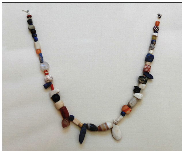
Figure 8. Ce très élégant collier en pierres semi-précieuses, issu des fouilles de Sari-Dheri / Sulai-Dheri, non loin de Peshawar, témoigne du savoir-faire des artisans harappéens. (Musées royaux d'Art et d'histoire de Bruxelles, photo © Jacques Gossart)

La société harappéenne comprenait différentes classes sociales. La majorité de la population était représentée par les paysans et artisans, les traces de leur production en témoignent abondamment. Les classes supérieures, quant à elles, occupaient une grande variété de fonctions, comme on a pu le déterminer notamment par l'examen des sceaux en stéatite. Outre la classe des chefs politiques, on trouve ainsi des scribes, des personnes en charge des poids et mesures, des capi-