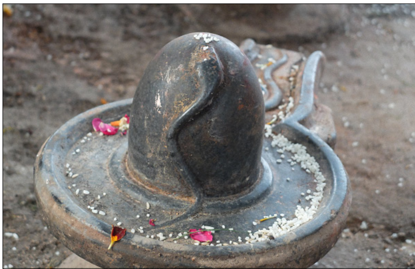
Figure 5. Un des innombrables liṅga de Bénarès, la cité de Śiva.

L'art rupestre n'est pas absent de la péninsule, loin de là ; par son abondance, sa qualité et son originalité, il occupe même une place à part. Les plus anciennes peintures rupestres, datées de 26 000 AEC, se trouvent à Bhimbetka, au sud des monts Vindhya et à une quarantaine de kilomètres de Bhopal. On y compte six cent cinquante abris sous roche, dans lesquels sont exposées plus de quinze mille peintures, couvrant une période d'une dizaine de millénaires, « jusqu'à l'aube de l'histoire moderne » 22 . Les scènes, fort diverses, traitent de la vie de l'homme et de