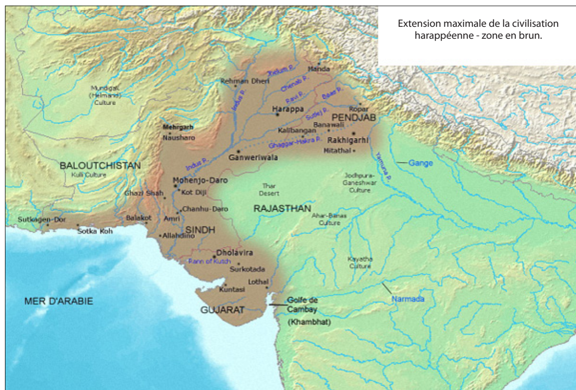
Figure 1. (D'après Avantuputra 7 & McIntosh 5 )

C'est donc ainsi que cette extraordinaire civilisation indusienne s'est peu à peu révélée aux fouilleurs, et il est aujourd'hui possible d'en dresser un portrait bien lacunaire encore, mais qui se complète peu à peu. Les recherches se poursuivent en effet, non seulement à Mohenjo-daro et à Harappa, mais aussi sur les nombreux sites disséminés tant à l'intérieur des terres que sur la côte.