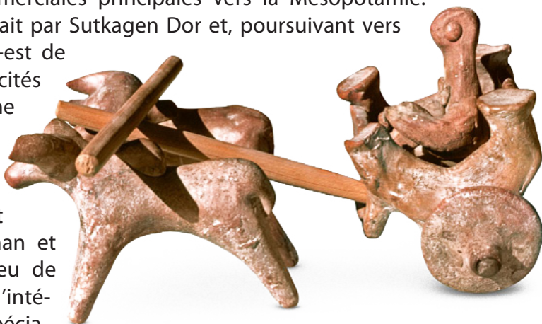
Figure 7. Maquette d'un char à bœufs, moyen de transport usuel des Harappéens.

La première, terrestre, passait par Sutkagen Dor et, poursuivant vers l'ouest et Tepe Yahia (sud-est de l'Iran), aboutissait aux cités sumériennes. La deuxième était maritime : au départ de villes portuaires comme Sotka Koh et Lothal, les embarcations rejoignaient les côtes des golfes d'Oman et Persique. Enfin, on sait peu de choses sur la circulation à l'intérieur du pays, mais les spécialistes estiment qu'à côté d'un réseau routier bien développé, les cours d'eau – à commencer par l'Indus – devaient être régulièrement empruntés.