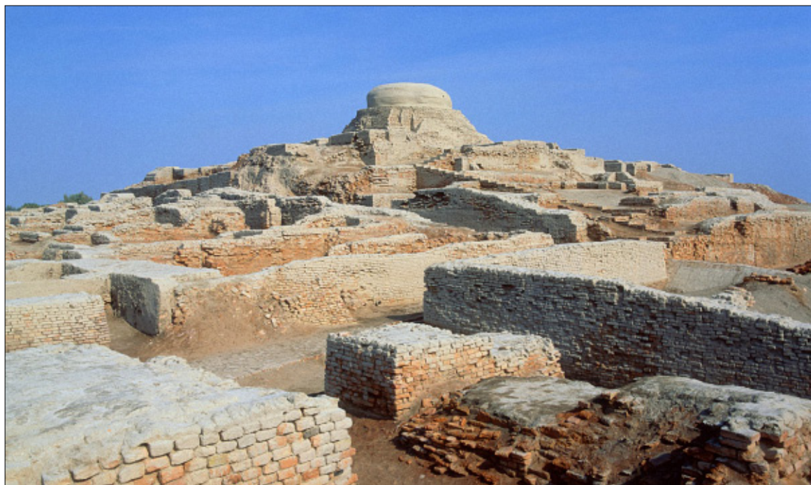
Figure 10. Vue générale de Mohenjo-daro. À l'arrière-plan, un stupa bouddhique plus récent couronne la citadelle. (Sindhi Dunya)

Par bien des côtés, Mohenjo-daro peut faire penser à certaines de nos cités modernes, à commencer par ses dimensions : elle couvrait une surface de 150 ha environ, et abritait une population proche des 40 000 habitants. Par son plan ensuite, soigneusement établi selon des normes que l'on retrouve dans d'autres cités de l'Indus, telle Harappa, notre prochaine étape. On distingue ainsi une ville haute, nommée dans la littérature « acropole » ou « citadelle », située à l'ouest, et une ville basse résidentielle à l'est. À ce jour, et contrairement à d'autres cités comme Harappa et Lothal, aucun cimetière n'a été localisé à Mohenjo-daro. Mais il est impensable qu'une ville aussi importante ait pu se passer de nécropole ; un cimetière doit donc forcément exister quelque part, dissimulé sous les alluvions. Cela dit, quelques squelettes – 38 exactement – ont été mis au jour... dans des zones d'habitation.