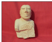
Illustration de page de titre : cette célèbre statuette dite « du roi-prêtre », haute de 17,5 cm, est en stéatite. Mise au jour à Mohenjo-daro en 1927, elle est aujourd'hui exposée au Musée national de Karachi. (fac-sim., coll. Ivan Verheyden)