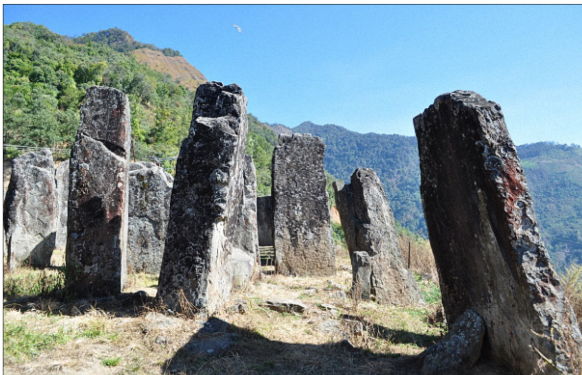
Figure 4. Le site mégalithique de Willong Khullen. (Ram & Reshma)

Dans cette dernière phase de la préhistoire indienne, il faut encore mentionner le mégalithisme, fort tardif par rapport à d'autres régions du monde puisque les monuments les plus représentatifs sont postérieurs au V e siècle AEC. Parmi les sites les plus remarquables, on retiendra celui de Willong Khullen (État de Manipur, extrême-est), que certains ont qualifié de « Stonehenge indien ». C'est peut-être aller un peu loin. Certes, du seul point de vue visuel, cet ensemble de pierres dressées soutient la comparaison avec de nombreux sites européens – les plus grandes pierres atteindraient les sept mètres 19 – et on comprend aisément l'enthousiasme des visiteurs. Mais, à défaut d'études de terrain, rien ne permet pour l'instant de préciser les fonctions de Willong Khullen, qu'elles soient de nature astronomique, cultuelle ou autre.