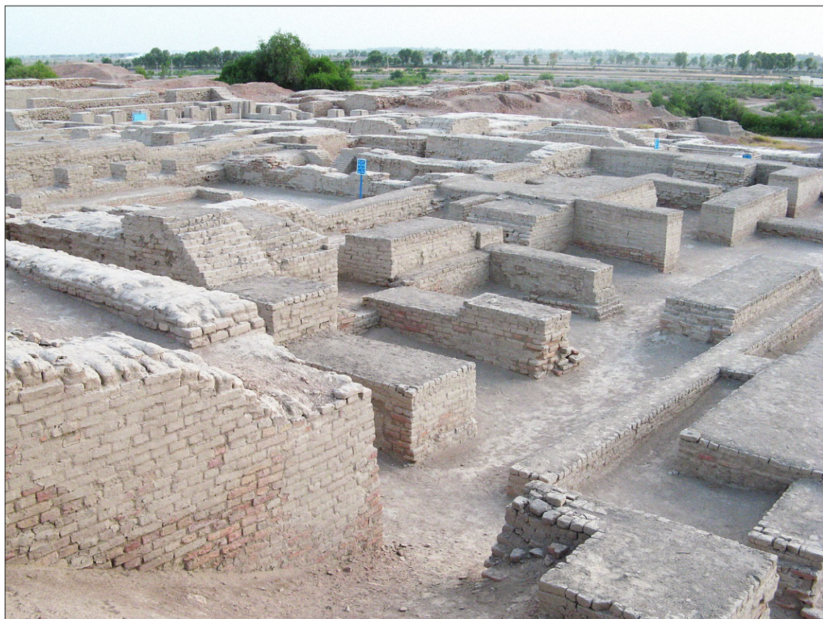
Figure 11. Une partie du site de Mohenjo-daro. (Comroques from San Francisco, California)

grenier à grains comportant plusieurs plates-formes, d'autre part un étrange bâtiment de 55 m sur 33, dénommé « grand bain » en raison du bassin installé en son sein, au centre d'un espace carré entouré de cabines et de galeries à colonnes. Cette sorte de piscine, à laquelle on accédait par deux escaliers, est de dimensions respectables, soit 11,70 m sur 6,90 m, pour une profondeur de 2,40 m. Faite de briques sans mortier, son étanchéité est assurée par une couche de bitume de trois centimètres d'épaisseur, et un système d'alimentation et d'évacuation permettait le renouvellement de l'eau 40 . (Nous reviendrons sur la finalité de ce bassin lorsque nous aborderons la question religieuse.) Quant aux maisons de la ville basse, elles sont souvent construites en briques crues, la brique cuite étant généralement réservée aux structures au contact de l'eau. Ces briques sont de dimensions standardisées, 7 x 15 x 31 cm très précisément. En raison des reconstructions successives les unes sur les autres et dans un parfait alignement, ces habitations à toit plat donnent l'impression de comporter plusieurs étages. Il en est de même pour les puits qui, en raison des surélévations successives, apparaissent aujourd'hui comme des cheminées d'usine.