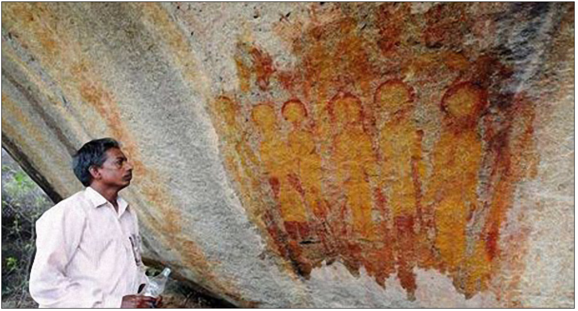
Figure 6. Quelques-uns des prétendus « extraterrestres » de Charama. À noter la méthode utilisée par ce quidam pour raviver les couleurs : les peintures sont copieusement arrosées d'eau. Idéal pour la photo, désastreux pour l'œuvre. (Amit Bhardwaj)