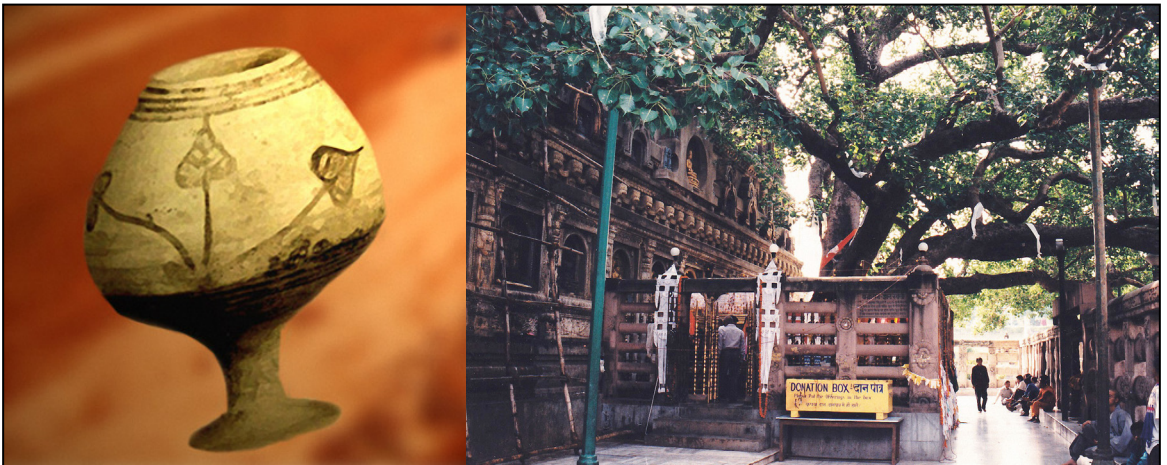
Figure 16. L'importance de l'arbre pipal est attestée en Inde à toutes les époques, depuis la représentation de ses feuilles sur une coupe harappéenne, jusqu'à la vénération dont il fait aujourd'hui l'objet à Bodhgayā, lieu d'illumination du Buddha.

Nous ne quitterons pas cette zone des cimetières sans jeter un œil sur le dénommé « H » lequel, comme dit précédemment, date d'une période post-harappéenne, à savoir 1900 à 1300 AEC. On y voit une transition vers d'autres pratiques funéraires puisque, dans la couche la plus ancienne (strate II), les corps conservent la position allongée du cimetière R37, mais les genoux sont ici légèrement fléchis et l'orientation est différente : est / ouest ou sud-est / nord-ouest. Par contre, dans la strate I, plus récente, on passe à des inhumations en jarre. Cela étant, en dépit des changements dans le mode d'inhumation, nous restons dans la continuité de la période harappéenne, avec des décors de poterie typiques, telle la feuille de l'arbre pipal ( Ficus religiosa ), arbre de tout temps sacré en Inde, depuis les temps pré-védiques jusqu'à nos jours. (Faut-il le rappeler, c'est sous un arbre pipal que, selon la tradition, le prince indien Siddhārtha Gautama devint Buddha.)