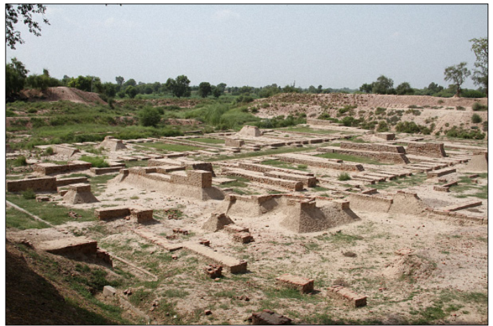
Figure 13. Vue partielle du site archéologique de Harappa. (Smn121)

Deuxième étape de notre voyage en Indusie, la cité éponyme de Harappa est, rappelons-le, la première à avoir été fouillée. Le site historique de Harappa – du nom de la ville moderne toute proche – est situé dans la province pakistanaise du Pendjab, en bordure de l'ancien lit de la Ravi, un affluent de l'Indus, et à environ 680 km (distance « utile » toujours) au nord-est de Mohenjo-daro. Contrairement à cette dernière, on ne connaît pas vraiment la signification du nom « Harappa ». Plusieurs hypothèses ont été avancées, qui n'ont guère convaincu. On a ainsi imaginé qu'il serait dérivé de « Arrapha » ou « Arrapkha », du nom d'un lieu situé en Mésopotamie, à l'emplacement de l'actuelle Kirkouk en Irak. On a également suggéré qu'il viendrait