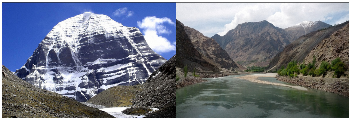
Figure 2. Le mont Kailash et, à droite, le fleuve Indus dans le nord du Pakistan.