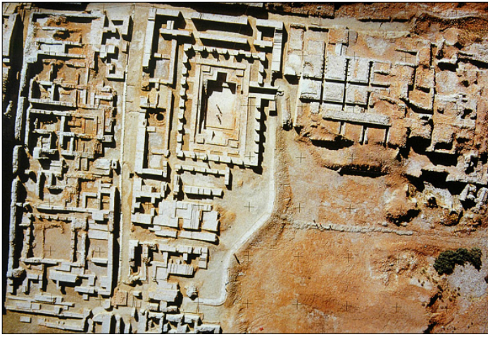
Figure 12. Vue aérienne de la citadelle de Mohenjo-daro. Au centre, le « grand bain » et, à droite, les plates-formes du supposé grenier. (Forschungsprojekt Mohenjo-daro)

tions par un réseau de distribution, parfois complété par un puits privé. Quant aux eaux usées, elles étaient évacuées par un système d'égouts aboutissant à des puisards ; une installation qui ne pouvait fonctionner que si la vidange était périodiquement assurée, par les services publics sans doute 41 . Les habitations étaient groupées en quartiers populaires et résidentiels qui s'étendaient jusqu'à la zone agricole. Le plan de cette ville basse est tout à fait remarquable, avec de larges rues prin-